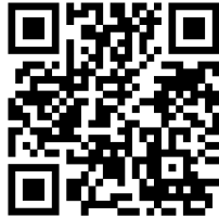
QR CODE du live timing