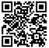
QR CODE de tous les résultats de la manifestation